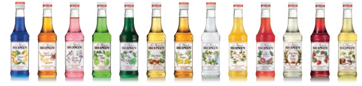
• Blue Curacao 블루 큐라소 • Caramel 카라멜 • Cherry Blossom 체리 블러썸 • Green Apple 그린 애플 • Green Mint 그린 민트 • Hazelnut 헤이즐넛 • Mango 망고 • Mojito Mojito 모히토 • Passion Fruit 패션 프룻 • Pink Grapefruit 핑크 그레이프프룻 • Pure Cane Sugar 케인슈가 • Strawberry 스트로베리 • Vanilla 바닐라