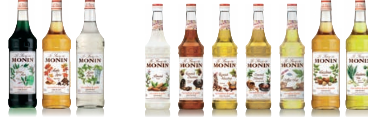
• Green Mint 그린 민트 • Maple Spice 메이플 스파이스 • Mojito 모히토 민트 • Almond 아몬드 • Roasted Chestnut 로스팅드 체스트넛 • Roasted Hazelnut 로스팅드 헤이즐넛 • Toasted Almond 토스팅드 아몬드 • Toffee Nut 토피넛 • Hazelnut 헤이즐넛 • Macadamia Nut 마카다미아넛