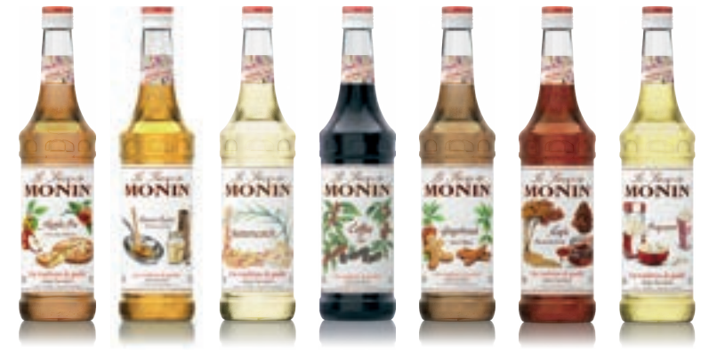
• Apple Pie 애플 파이 • Brown Butter 브라운 버터 • Butter-scotch 버터스카치 • Coffee 커피 • Gingerbread 진저브레드 • Maple 메이플 • Popcorn 팝콘