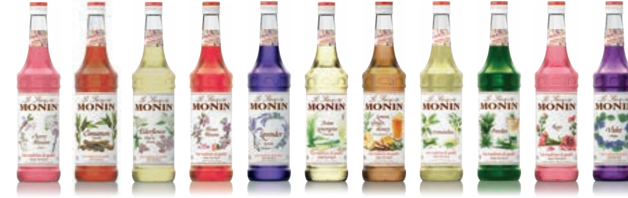
• Cherry Blossom 체리 블러썸 • Cinnamon 시나몬 • Elderflower 엘더플라워 • Flower Blossom 플라워 블러썸 • Lavender 라벤더 • Lemongrass 레몬그라스 • Lemon Ginger Honey 레몬 진저 • Osmanthus 오스만투스 • Pandan 판단 • Rose 로즈 • Violet 바이올렛