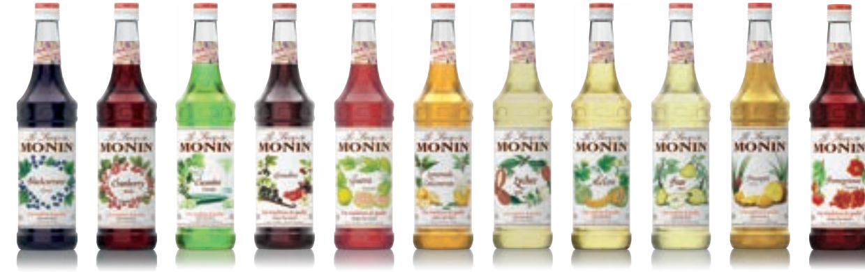
• Black-currant 블랙커런트 • Cranberry 크랜베리 • Cucumber 큐컴버 • Grenadine 그레나딘 • Guava 구아바 • Lemonade Concentrate 레모네이드 • Lychee 리치 • Melon 메론 • Pear 배 • Pineapple 파인애플 • Pomegranate 석류