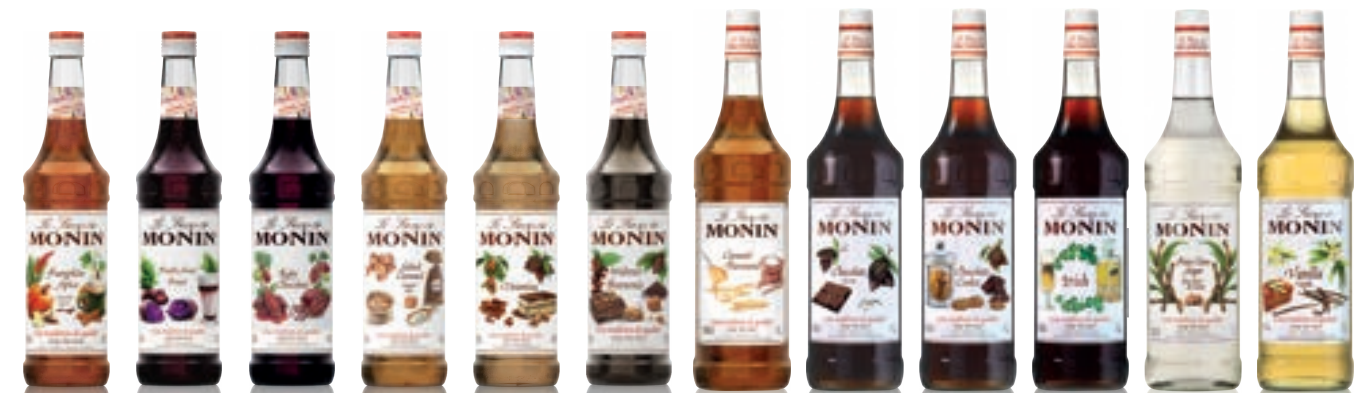
• Pumpkin Spice 펌킨 스파이스 • Purple Sweet Potato 자색고구마 • Ruby Chocolate 루비 초콜렛 • Salted Caramel 솔티드 카라멜 • Tiramisu 티라미슈 • Walnut Brownie 월넛 브라우니 • Caramel 카라멜 • Chocolate 초콜렛 • Chocolate Cookie 초콜렛 쿠키 • Irish 아이리쉬 • Pure Cane Sugar 케인슈가 • Vanilla 바닐라