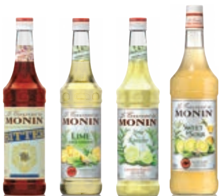
• Bitter 비터 • Lime Juice Cordial 라임 주스 코디얼 • Lime Rantcho 라임 란초 • Sweet & Sour 스위트 앤 사워