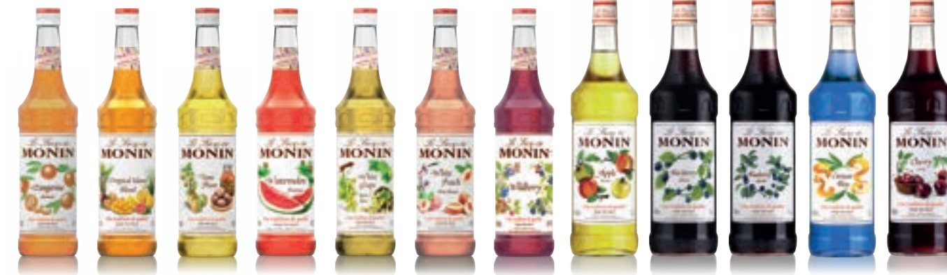
• Tangerine 탠저린 • Tropical Island Blend 트로피칼 아일랜드 블렌드 • Ume Plum 울메 플럼 • Watermelon 워터멜론 • White Grape 화이트 그레이프 • White Peach 화이트 피치 • Wildberry 와일드베리 • Apple 애플 • Blackberry 블랙베리 • Blueberry 블루베리 • Blue Curacao 블루 큐라소 • Cherry 체리