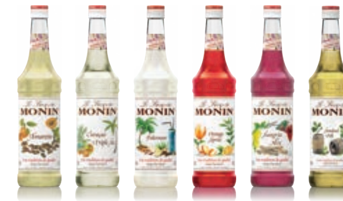
• Amaretto 아마레토 • Curacao Triple Sec 큐라소 트리플 섹 • Falernum 팔레넘 • Orange Spritz 오렌지 스프릿 • Sangria Mix 상그리아 믹스 • Smoked Oak 스모크드 오크