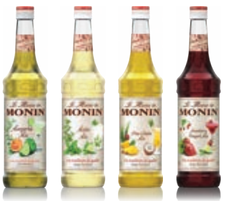
• Margarita Mix 마가리타 믹스 • Mojito Mix 모히토 믹스 • Pina Colada Mix 피나콜라다 믹스 • Strawberry Daiquiri Mix 스트로베리 다이키리