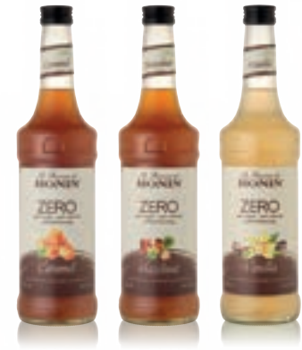
• Zero Caramel 제로 카라멜 • Zero Hazelnut 제로 헤이즐넛 • Zero Vanilla 제로 바닐라