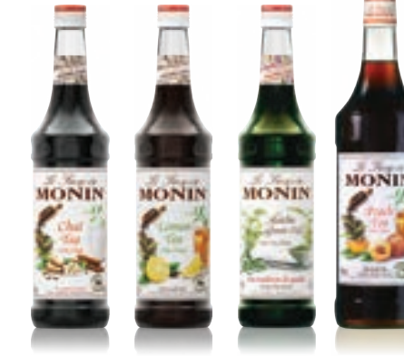
• Chai Tea 차이티 • Lemon Tea 레몬티 • Matcha Green Tea 마차 그린티 • Peach Tea 피치티